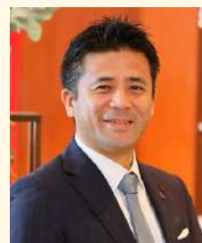
Kafuu Resort Fuchaku CONDO・HOTEL AQUASENSE Hotel & Resort 統括総支配人