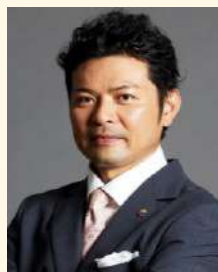
ホテルバームロイヤルNAHA国際通り 代表取締役総支配人